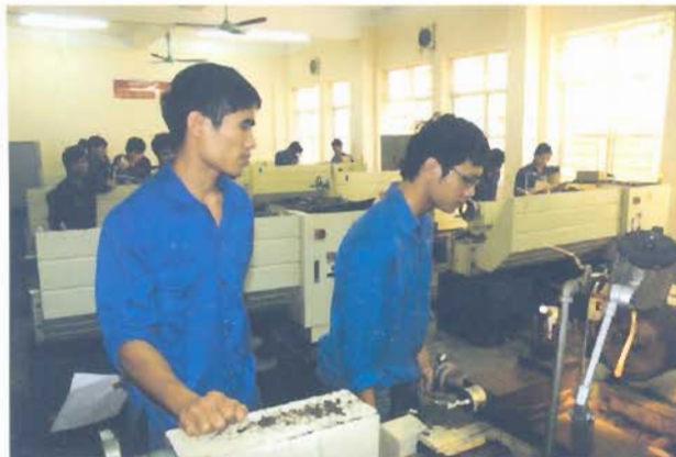
Thực hành tiện nâng cao