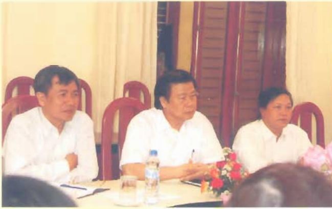
Ông Đàm Hữu Đắc - Thứ trưởng thường trực Bộ Lao động Thương binh và Xã hội thăm và làm việc tại trường về hướng phát triển của nhà trường(2009)

LEADERS OF THE MINISTRY OF LABOUR - INVALIDS - SOCIAL AFFAIRS AND THE CITY OF HANOI PAY A VISIT AND WORK AT THE COLLEGE.