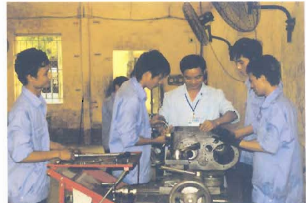
Thực hành sửa chữa máy