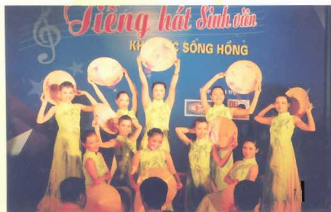
Tham gia liên hoan tiếng hát sinh viên khu vực Sông Hồng