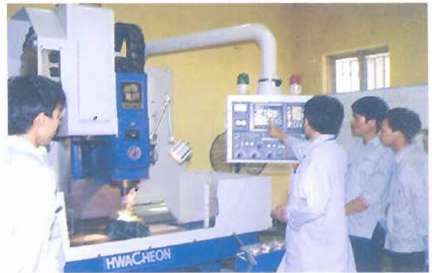
Thực hành trên máy điều khiển số