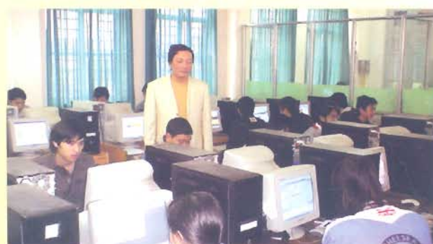
Giờ thực hành