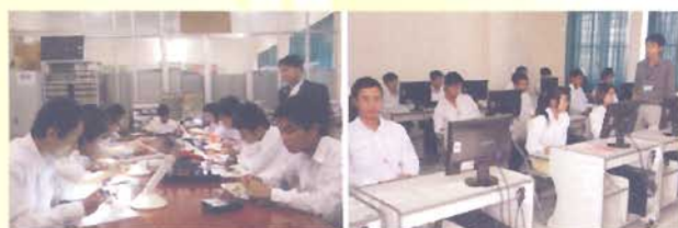
Giờ thực hành