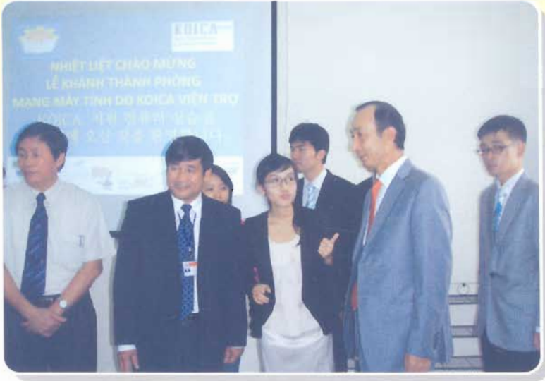
Ngài Trưởng đại diện Ủy ban Hợp tác Quốc tế của Hàn Quốc (Koica) tại Việt nam trong lễ khánh thành phòng mạng máy tính do Koica tài trợ