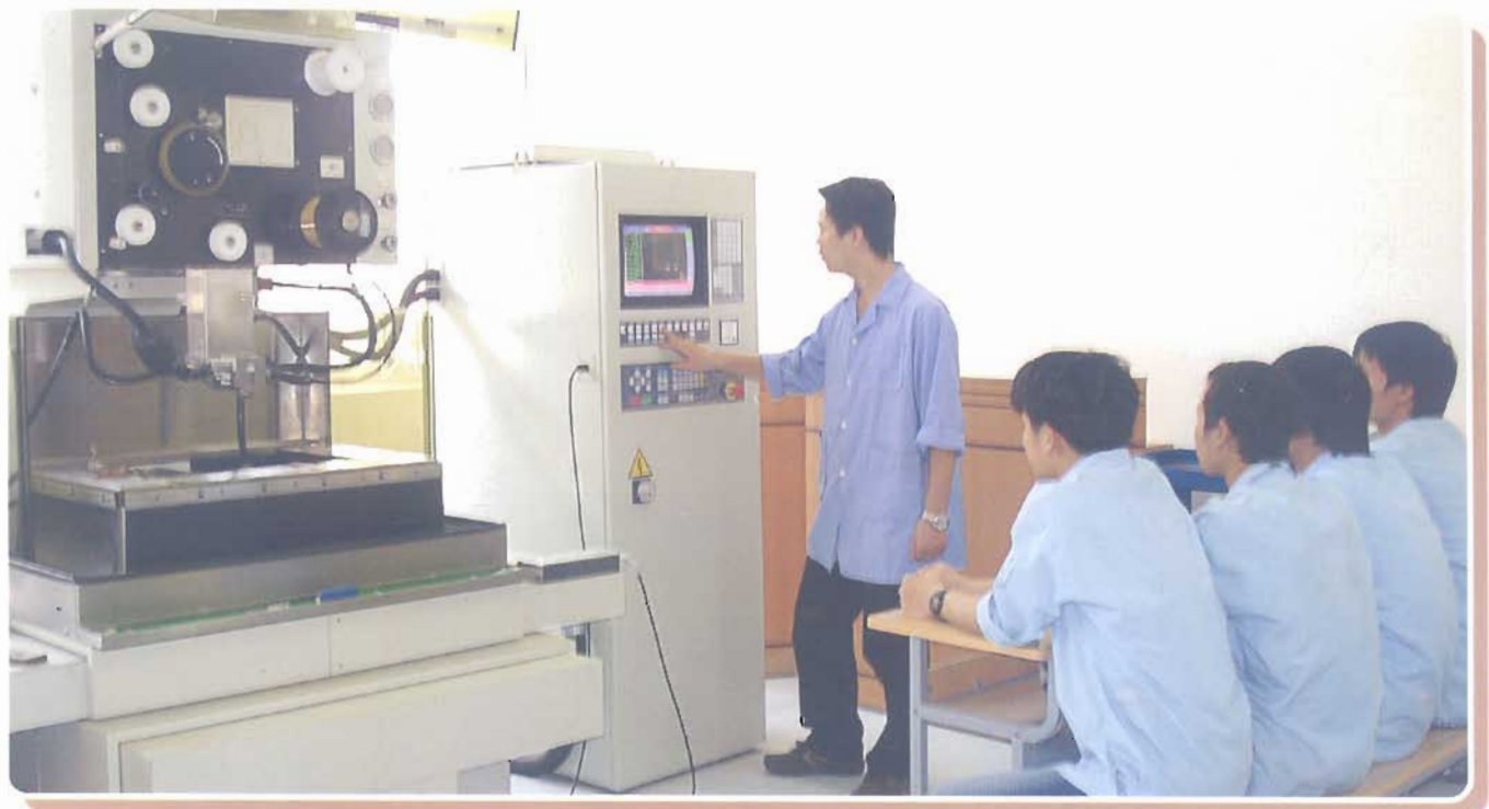
Hướng dẫn thực hành gia công chi tiết khuôn trên máy cắt dây EDM