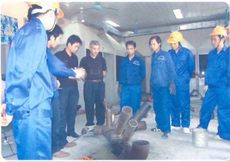
Lớp học phương pháp hàn ống dẫn dầu khí do chuyên gia Italya giảng dạy cho học viên đi lao động tại nước ngoài