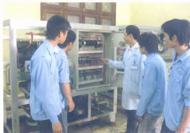
Phòng thực hành điện lạnh