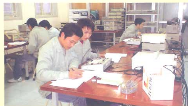
Giờ thực hành