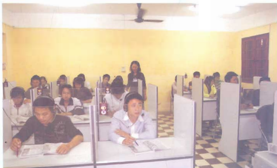
Phòng học ngoại ngữ