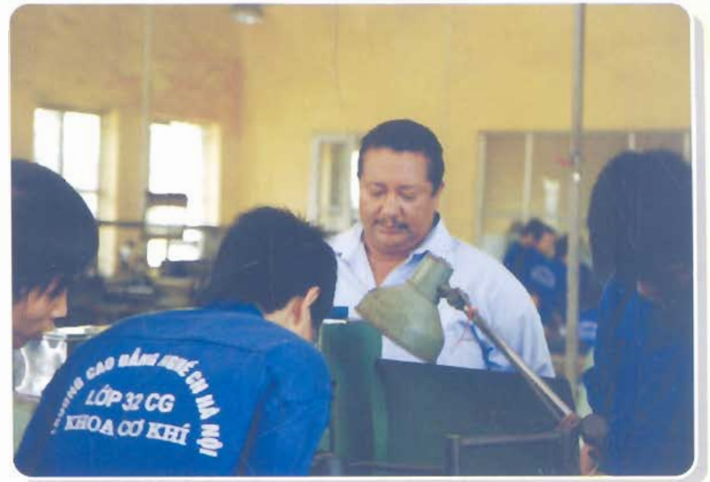
Đại diện Bộ giáo dục Angola thăm và làm việc tại nhà trường