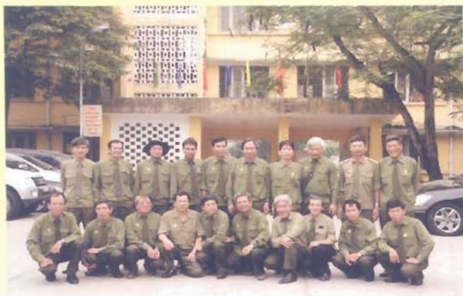
Hội cựu chiến binh nhà trường