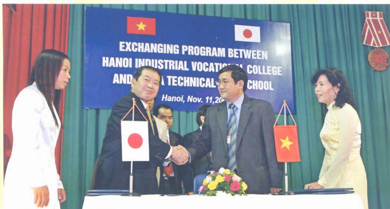
Lễ ký kết hợp tác giữa nhà Trường với Trường Kỹ thuật thuộc Tỉnh Chi Ba - Nhật Bản