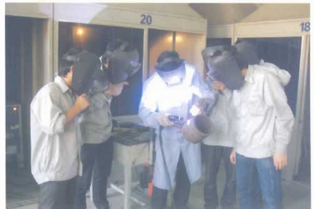
Thực hành hàn công nghệ cao