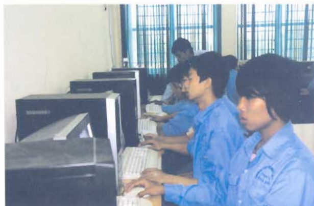
Thực hành lập trình P.L.C