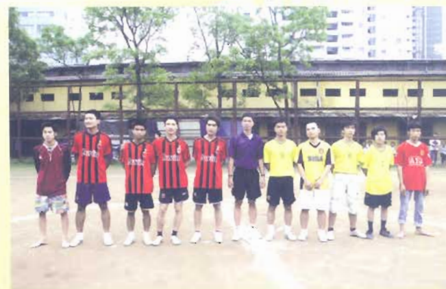
Phong trào thể dục, thể thao