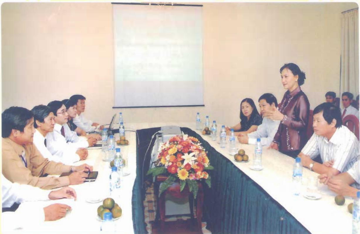
Bà Nguyễn Thị Kim Ngân - Bộ trưởng Bộ Lao động Thương binh và Xã hội làm việc với trường về đào tạo lao động nhập cư tại Phần Lan (10/2008)