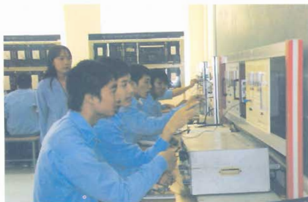
Phòng thí nghiệm điện cơ bản