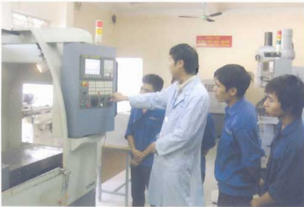
Máy gia công trung tâm CNC