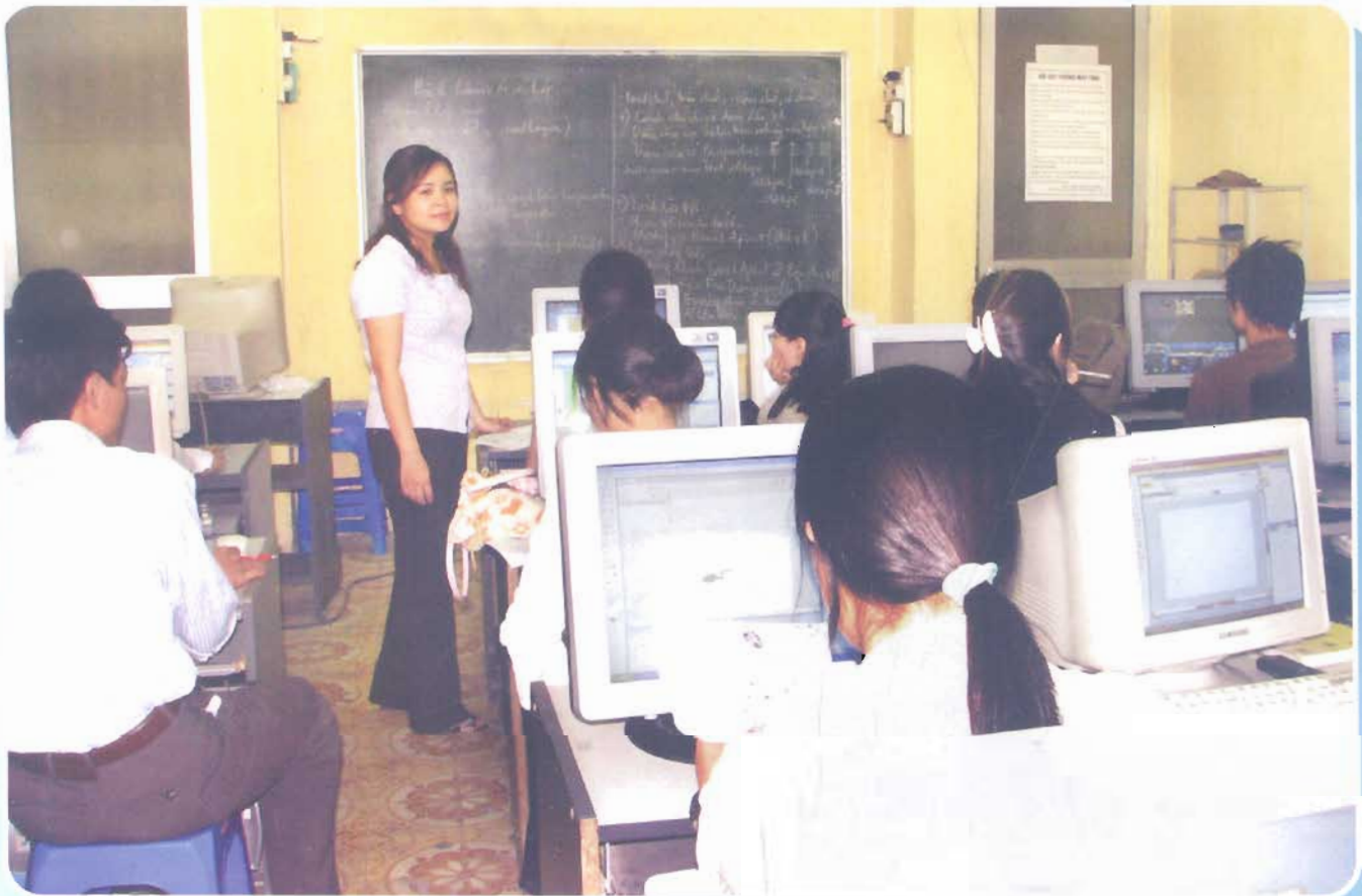
Thực hành thiết kế đồ họa