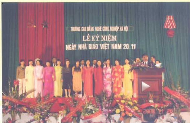
Hoạt động kỷ niệm ngày nhà giáo Việt Nam