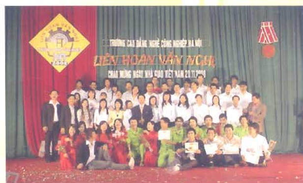
Liên hoan Văn nghệ